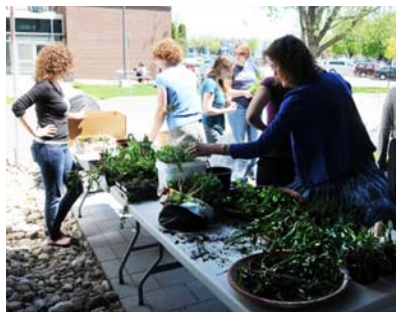
Le comité En Vert et pour Tous

Les plantes qui n'ont pas trouvé preneur ont été utilisées pour agrémenter les plates-bandes de la cour intérieure de la Faculté. Vous pouvez déjà voir les résultats. De beaux projets d'aménagement sont prévus sous peu. Sachez également que grâce aux sommes amassées, le comité En Vert et pour Tous pourra continuer à vous offrir de nouvelles activités à saveur environnementale en septembre.