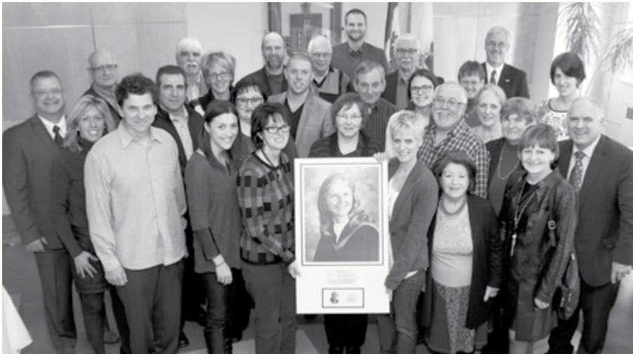
Lors de l’événement de reconnaissance, des représentants de la Faculté et les premiers administrateurs de la Fondation Régina De Vos accompagnaient les amis de la famille.